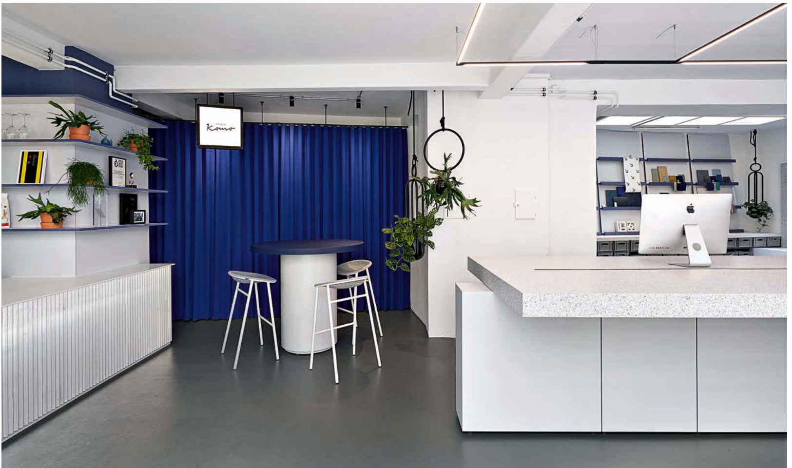
Der Stehtisch kann an den Team-Arbeitstisch angedockt werden; hinter dem blauen Vorhang verbirgt sich das Lager. • The standing table joins the worktable, the storage room is behind the blue curtain.