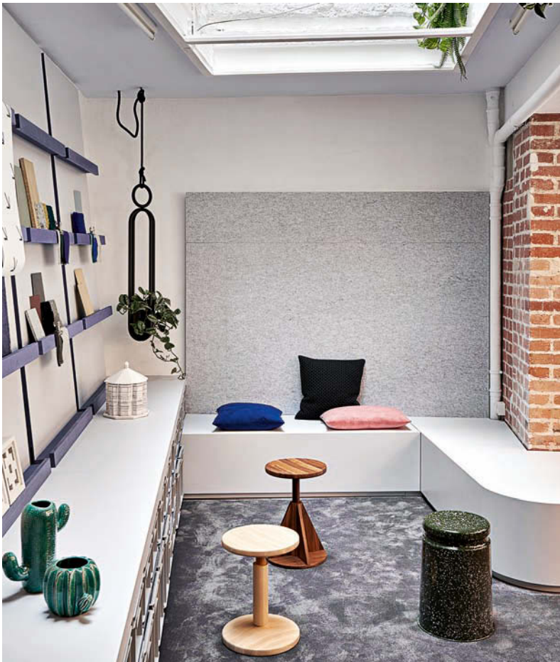
Materiallab mit Boards zum Collagieren • Material lab with boards for collages