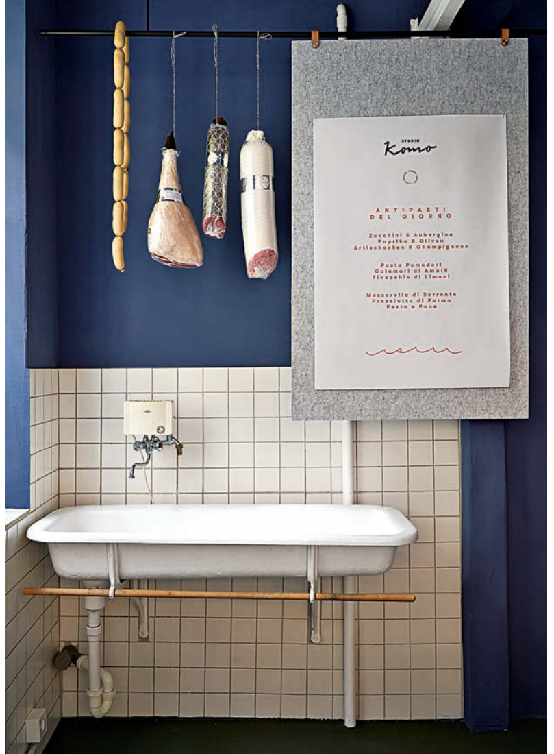
Aus dem Bestand aufgehübscht: das Küchenwaschbecken • Upgraded from the stock: the kitchen sink