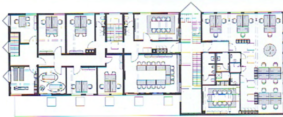
2ND FLOOR PLAN