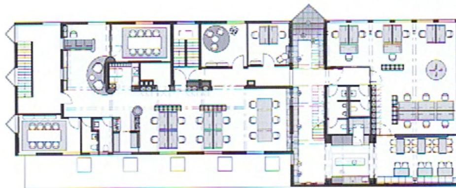
1ST FLOOR PLAN